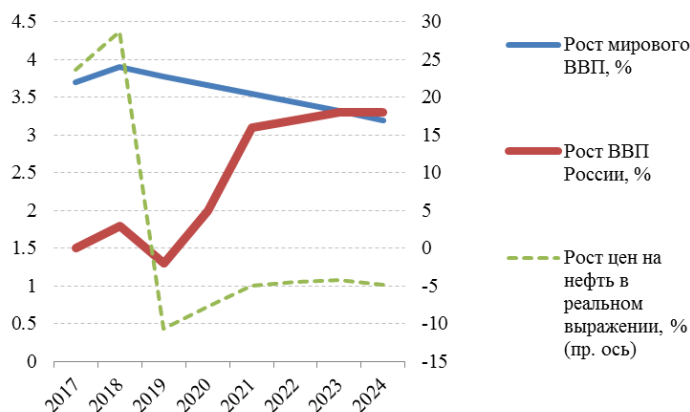
Рис. 1.1 Динамика ВВП России и внешних факторов экономического роста в базовом сценарии